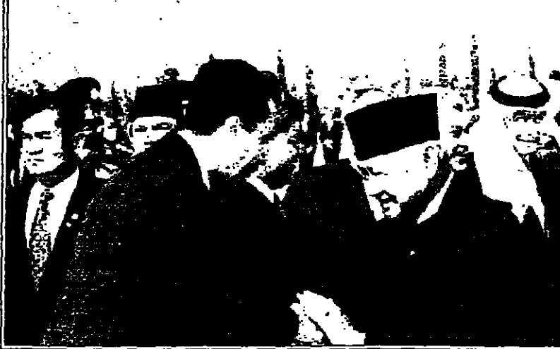
الحقائب مع ميلاد الحسين